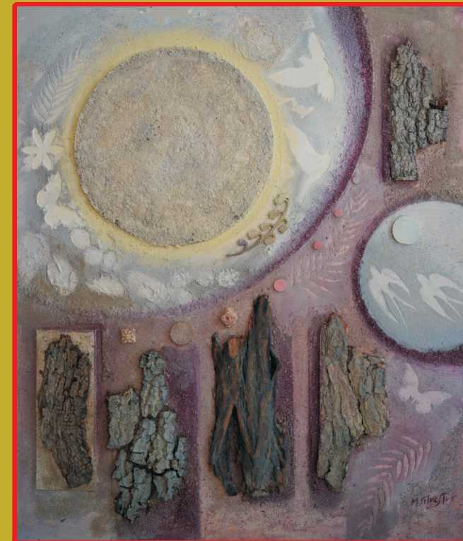
‘Coscienza ecologica’ di Marcello Silvestri - Galleria Arte Contemporanea - Pro Civitate Christiana-La Cittadella, Assisi

Hotel Costa Verde, Cefalù / 11-14 aprile 2024